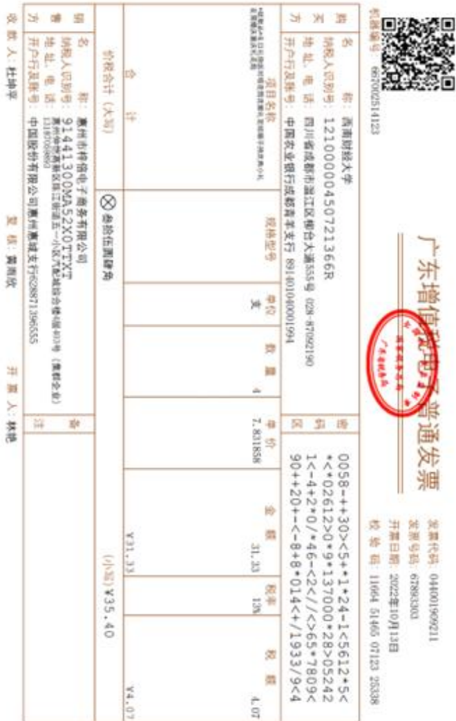
附: 发票打印比例大小图